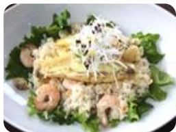
★海鮮丼 (井!?) リア

150gハンバーグを 使い、ボリューム満点。 ロコモコ風なので 混ぜて食べてください。