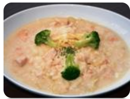
★サーモンクリームのスープパスタ