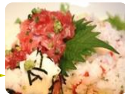
★まぐろと長いも丼 <数量限定>