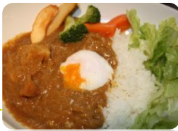
★カレーライス (まろやか甘口)

定番のミートソースと 温泉玉子の巡りあい。 シンプルな味と アルデンテ麺との 絡みも最高です。