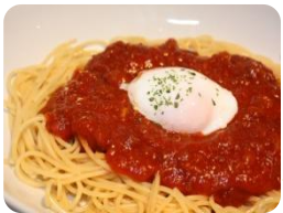
★ミートソーススパゲッティ