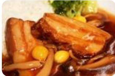
★信州マーブルポークの角煮丼

信州マーブルポークを じっくり煮た やわらか角煮丼です。 がっつり食べたい方、 スタミナ不足の方に おすすめです。