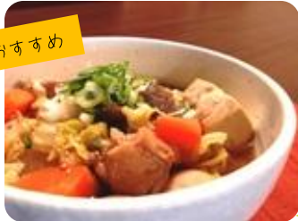
★信州みそと冬野菜のけんちんそば

信州そばと信州みその コラボレーション! あったか野菜が ココロとカラダを 温めます